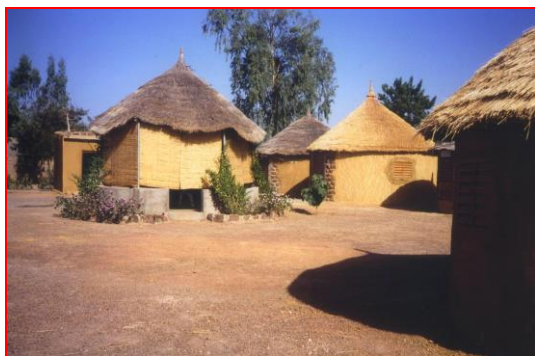
Le campement d'accueil pour l'activité de tourisme solidaire.