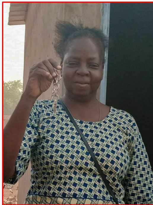
Réfection des latrines du collège St Anthyme

Nous avons renouvelé notre dotation pour le théâtre (380 €) afin que la troupe puisse intervenir dans les 2 établissements scolaires.