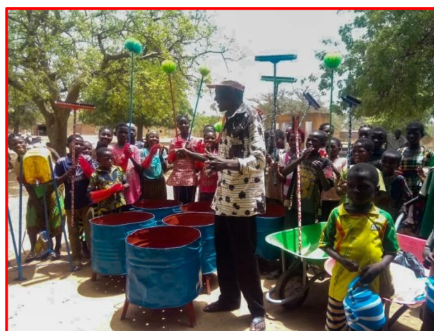
Jeu « Balai Santé » à l'école de Banankyo