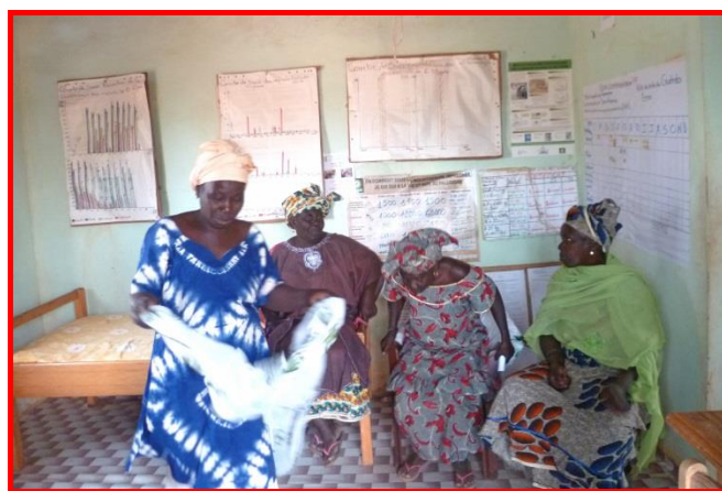
La case de santé.