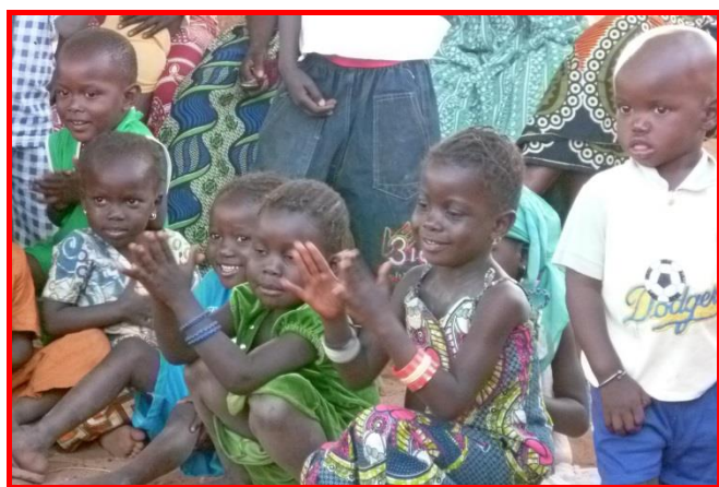
Les enfants dansent avec nous.

Si nous pouvons renouveler cette expérience, c'est bien volontiers que nous le ferons.