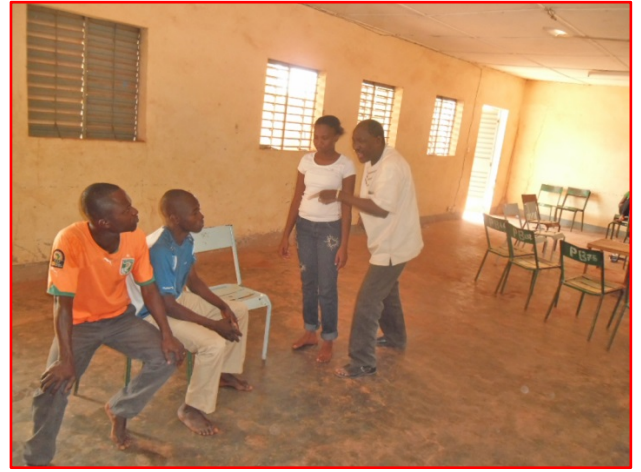
Stage de théâtre.