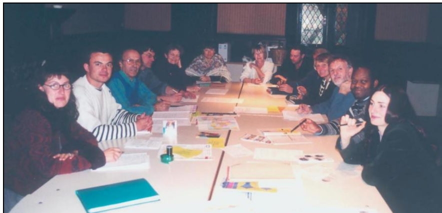
Des participants motivés, lors de notre Assemblée Générale 2001.

Notre prochaine Assemblée Générale se déroulera le mardi 11 mars à 20h00, à la maison IV de chiffre.