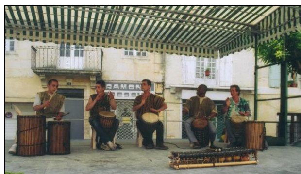
La troupe de « Mali Dambé » en pleine effervescence.