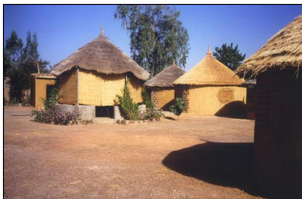
Le campement d'accueil pour l'activité de tourisme solidaire.