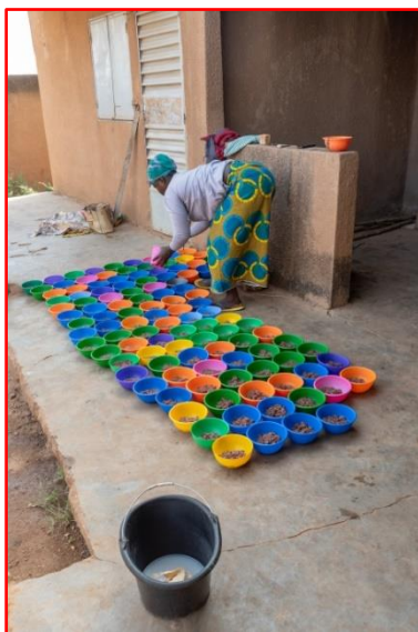
Préparation des repas

Nous avons décidé d'envoyer une aide financière de 200 €, afin de participer au financement des repas le midi, l'aide de l'état se faisant toujours attendre. Une centaine d'enfants est régulièrement accueillie dans le centre.