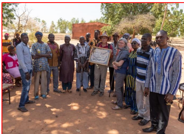
L'accueil à l'école de Banankio

• Ecole de Banankyo : nous avons financé l'achat de 5 tablettes et 5 connexions internet pour charger la version informatique du jeu, afin d'en faire profiter les enfants.