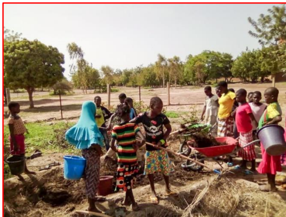
Le jardin scolaire

Nous avons financé aussi un jardin scolaire désormais clôturé et fermé par un portail. Le jardin possède un puits d'alimentation pour l'arrosage.